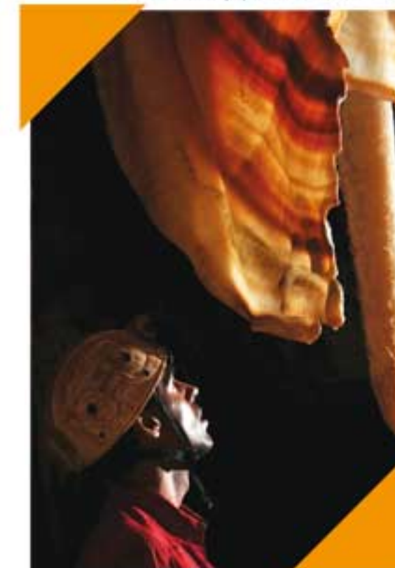
Grotte Bellony