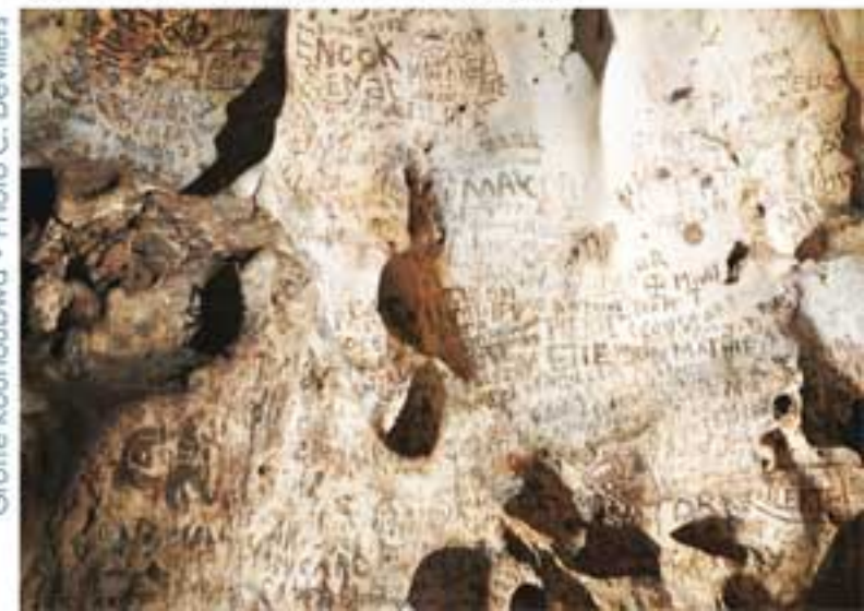
Grotte Kounoubwa

Patrimoine mal connu, les grottes ont toujours exercé sur l'Homme, craintes et fascinations. De nombreuses légendes courent à leur sujet leur conférant un caractère sacré.